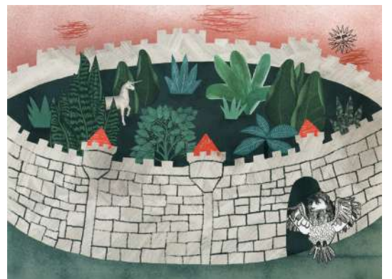
Vinjete Straholjubca, VigevageKnjige, 2019

Ilustracije Eve Mlinar so nastale za inovativno zastavljeno knjigo kot skupen projekt z avtorico besedila, saj so besede in podobe v njuni knjigi enakovredno prepletene. Izdelane so v mešani tehniki, večina pripada digitalnemu kolažu, največ fragmentov pa prihaja iz historičnih grafik in srednjeveških iluminiranih rokopisov. Izvirno groteskne, nadrealistične in duhovito sveže, a tu in tam skoraj strašljive kolažne ilustracije so namenjene potapljanju v ekscentrične vizualne pokrajine simbolov in podob.