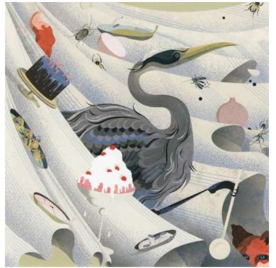
Čapljina pečenka (lahkonočnice), A1, 2020