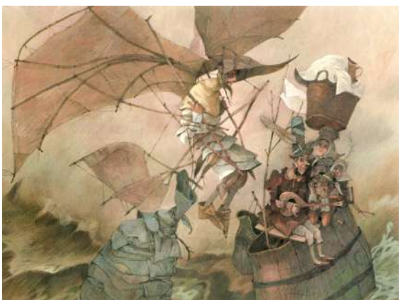
Rajski vrt, Miš, 2021

Za vsako pravljico, zgodbo ali pesem ima ilustrator Peter Škerl svoj slikarski odgovor, vedno pravljichen in resničen obenem, vselej dopolnjen s posebej dognanimi in ubranimi barvnimi odtenki. Nezgrešljivo samosvoj slog dopolnjuje včasih preprosta, drugič zapletena likovna tehnika. Ilustrator vselej uporablja tista orodja in tiste likovne prijeme, ki sodijo k besedilu, za katero nastanejo. Inovativne so tudi barvno harmonične ilustracije o bogu, ki mu je nadel povsem samosvojo izvirno podobo. Z večino ustvarjene krhke slikarske kompozicije simbolno prepričljivo nagovarjajo gledalca slikanice Rajskega vrta.