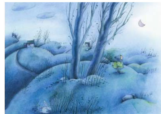
Sr(e)čna dežela, Ajda, 2018