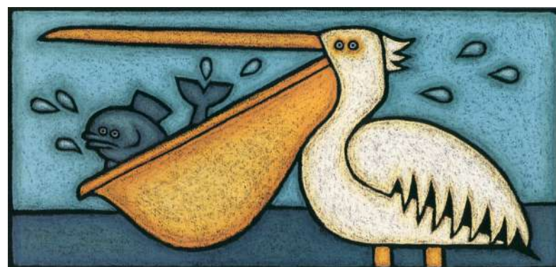
Ptiči?!, Mladinska knjiga, 2019