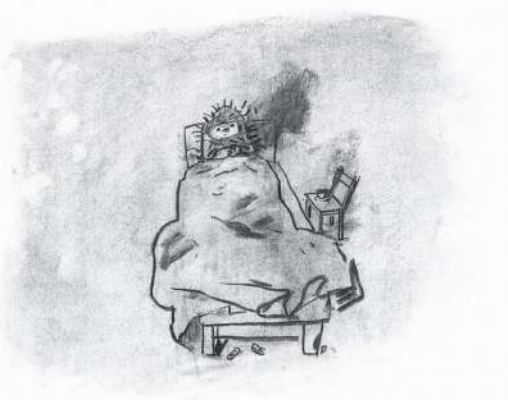
Jež in samotni občutek, Mladinska knjiga, 2020