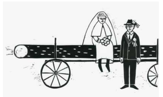
Sto dejstev o Prekmurju, Pomurski muzej, 2019

Ilustracije Tamare Rimele v tehniki linoreza v kombinaciji z računalniško grafiko so polne pastoralno-nostalgicnega izraza, a piktogramsko abstrahirane. To jih postavlja v današnji čas, s čimer dosegajo svoj namen v knjigi Sto dejstev o Prekmurju. Podlaga za ilustracije je predano raziskovanje tematike, tudi obrtniških znanj. Premišljena uporaba barvne podlage, ljubezen do klasične grafične tehnike in usklajenost z oblikovalko Brigito Klajnšek so vodila v odličnem izdelku.