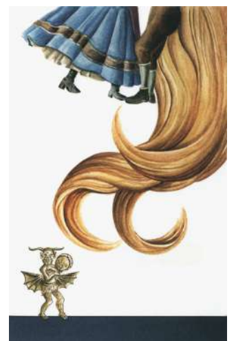
Visoška kronika, Modrijan, 2020

Ob stoletnici prve objave je izšel izvirni roman Visoška kronika z desetimi celostranskimi ilustracijami Maje Šubic. V belino vsake podobe so z značilnim kolažiranjem duhovito umeščeni emblematski elementi pripovedi, kot so beneški cekin in samokres, zadovoljni pujsi in grad, žebelj, igla in oster kamen. Razen podobe Visokega se prizori ne izgubljajo v nazornem ilustriranju pripovedi, medtem ko odsotnost figur duhovito blaži izvirno navzoča figurica hudiča.