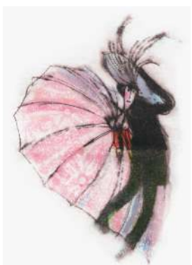
Roža v srcu, Mladinska knjiga, 2010

Prejel je nekaj pomembnih nagrad, med njimi: 1984 - Levstikova nagrada; 1993 - plaketa Hinka Smrekarja; 1997 - priznanje Hinka Smrekarja; 2010 - nagrada Hinka Smrekarja; 2013 - Levstikova nagrada za življenjsko delo; 2012 - častna lista Mednarodne zveze za mladinsko književnost (IBBY) za ilustracije v pesniški zbirki Roža v srcu Bine Štampe Žmavc; in 2021 - nagrada Hinka Smrekarja za življenjsko delo.