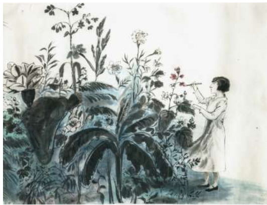
Mala Alma na veliki poti, Mladinska knjiga, 2020