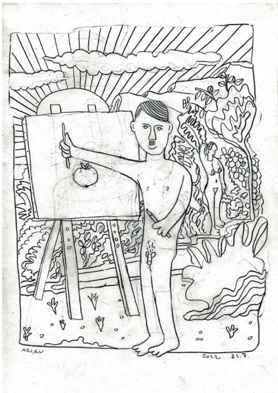
Arjan Pregl / Rojstvo slikarstva, svinčnik na papirju, 29,7 x 21 cm, 2022