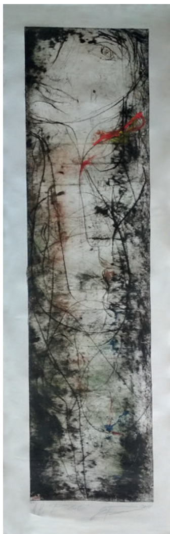
Eduard Belsky / Ona dva, papir, suha igla, mešana tehnika, 149 x 45,5 cm, 2010

Vodstvo skupine / Martina Marenčič, akad.kip. umetniška vodja festivala, LD Kranj