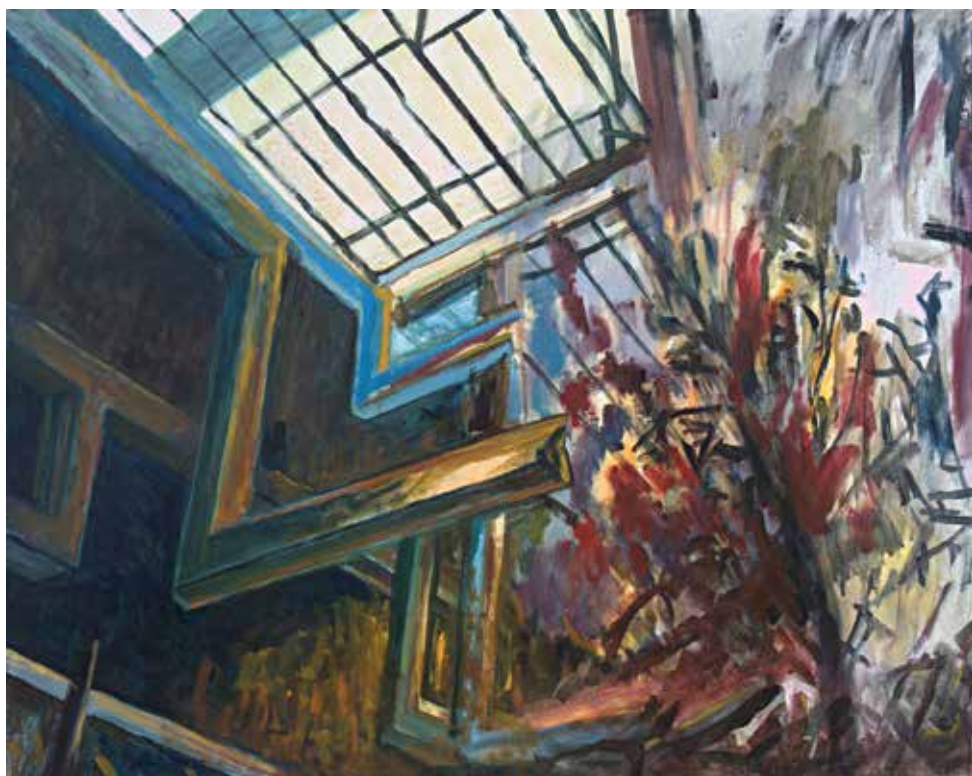
Domen Dimovski, Vdor, 2020, akril na platnu, 100 x 80 cm.