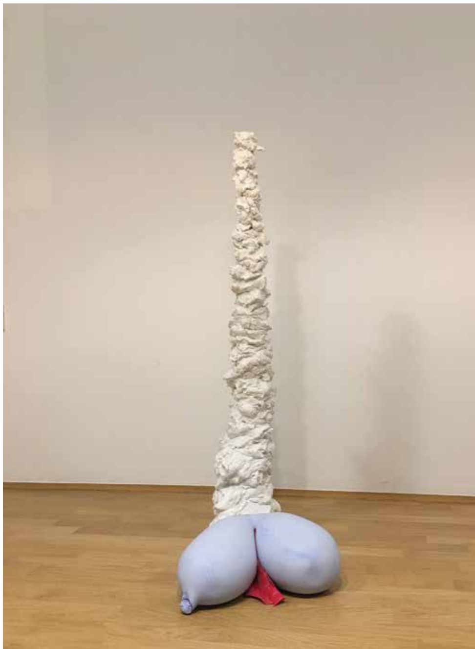
Matej Strojjan, Sveža kot gorski potok, 2020, mavec, pigment, deska za rezanje, 94 x 60 x 40 cm.