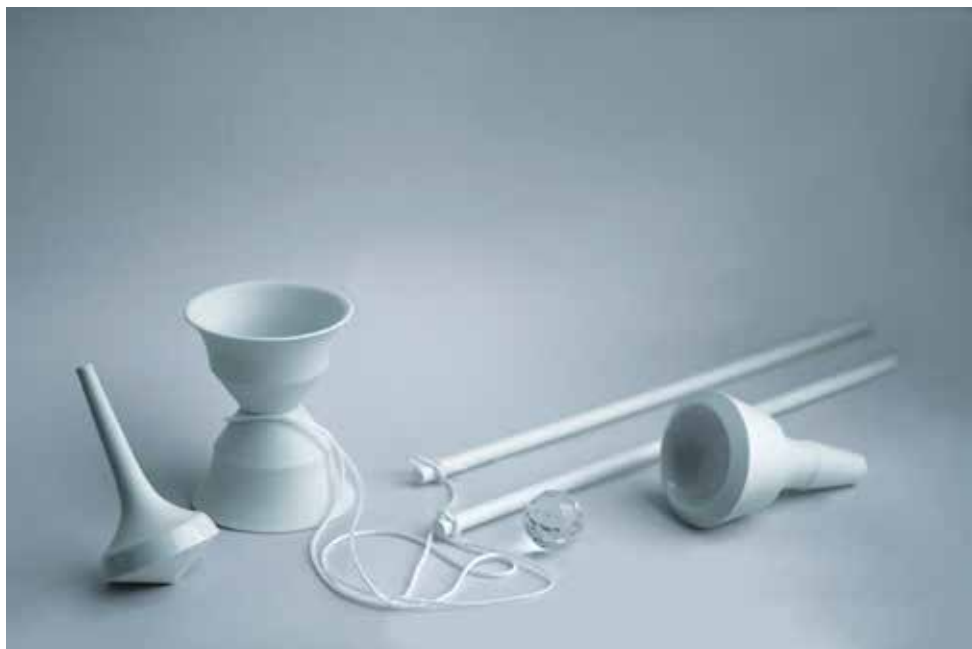
Maruša Mazej, Igračke, 2019, porcelan, vlivanje, žganje v plinski peči, od 12 do 14 cm.