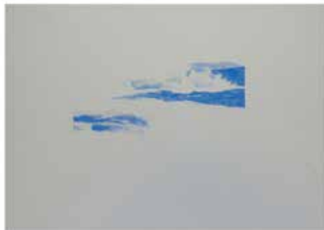
Neža Perovšek, Razglednice iz neznane dežele, 2020, barvni svinčnik na papirju, vsaka 36 x 51 cm.