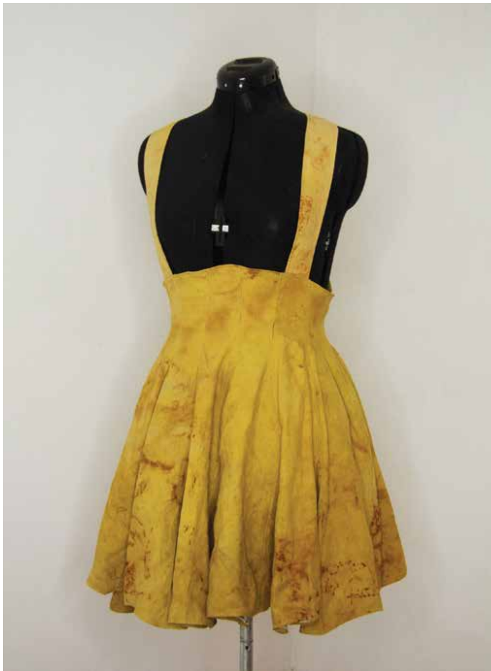
Anja Kužnik, Currency of Trash, 2020, oblikovanje in barvanje tekstilij, 80 x 50 cm.