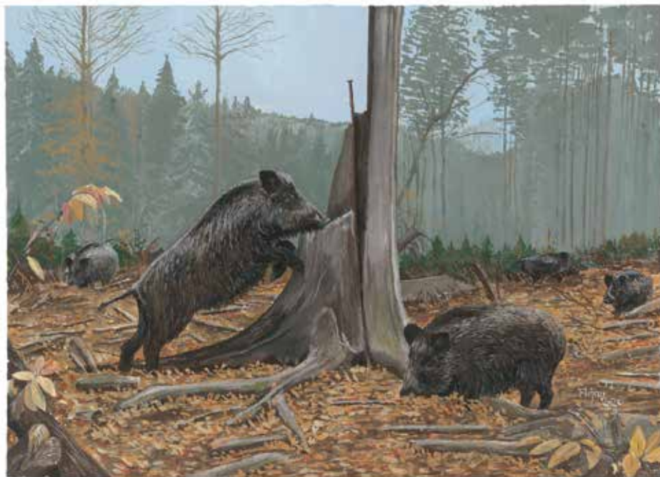
Martin Fujan, Trop divjih prašičev, 2020, gvaš, 28 x 38 cm.