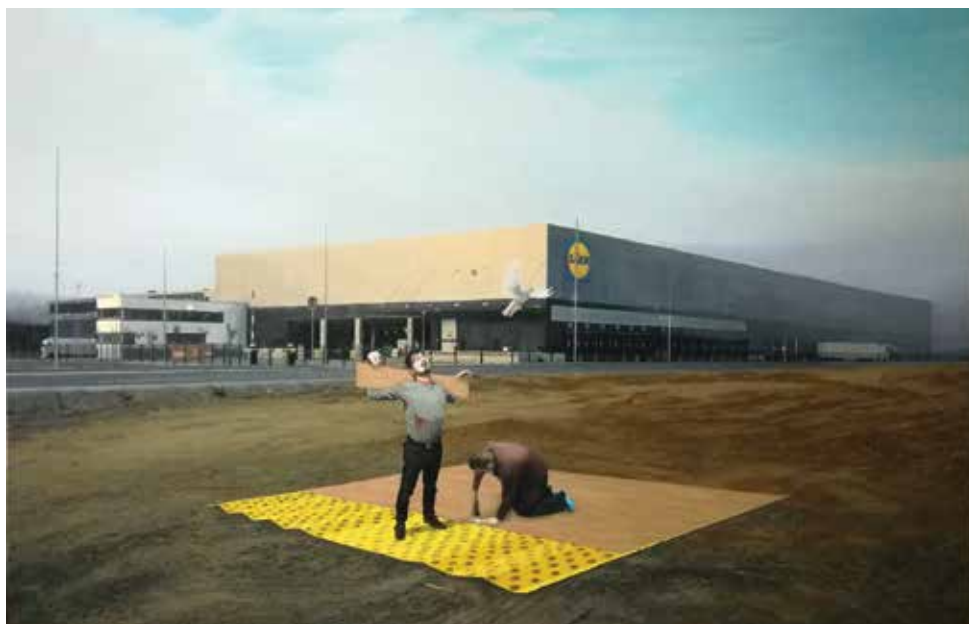
Klemen Zupanc, Liar, that's a pizza stain!, 2020, olje na platnu, 89 x 139 cm.