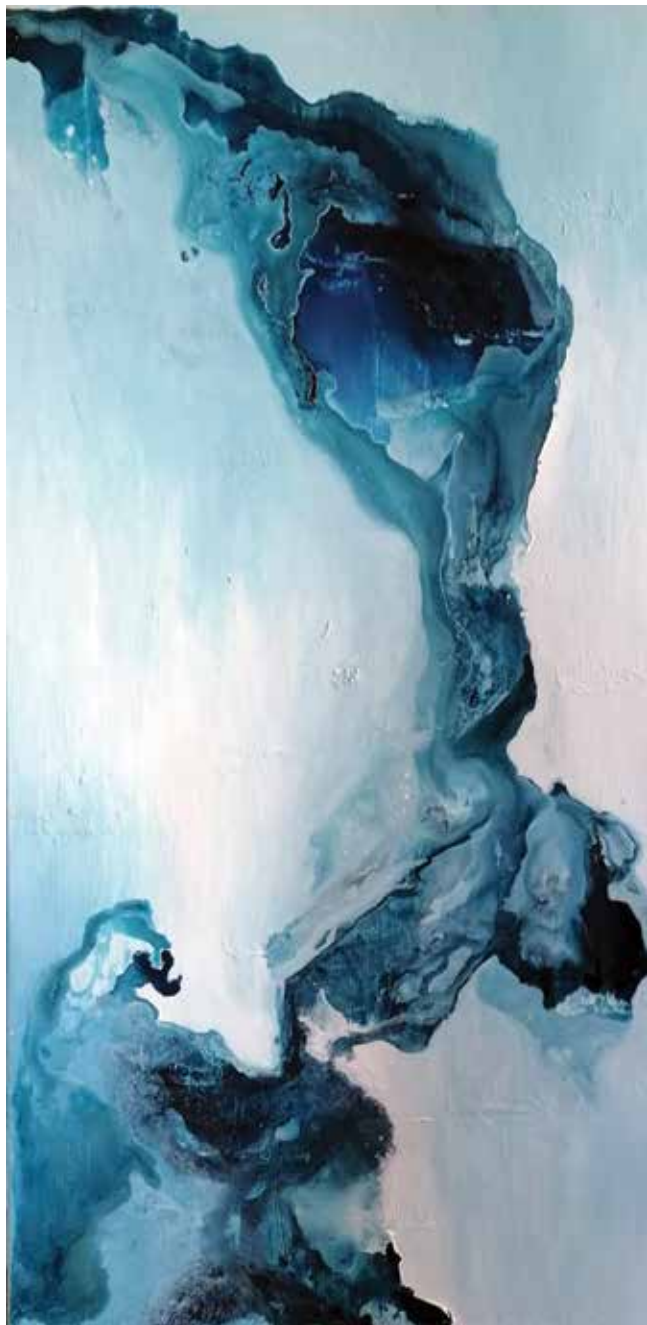
Anja Podreka, Med svetlobo in temo , 2020, akril na platnu, 100 x 50 cm.