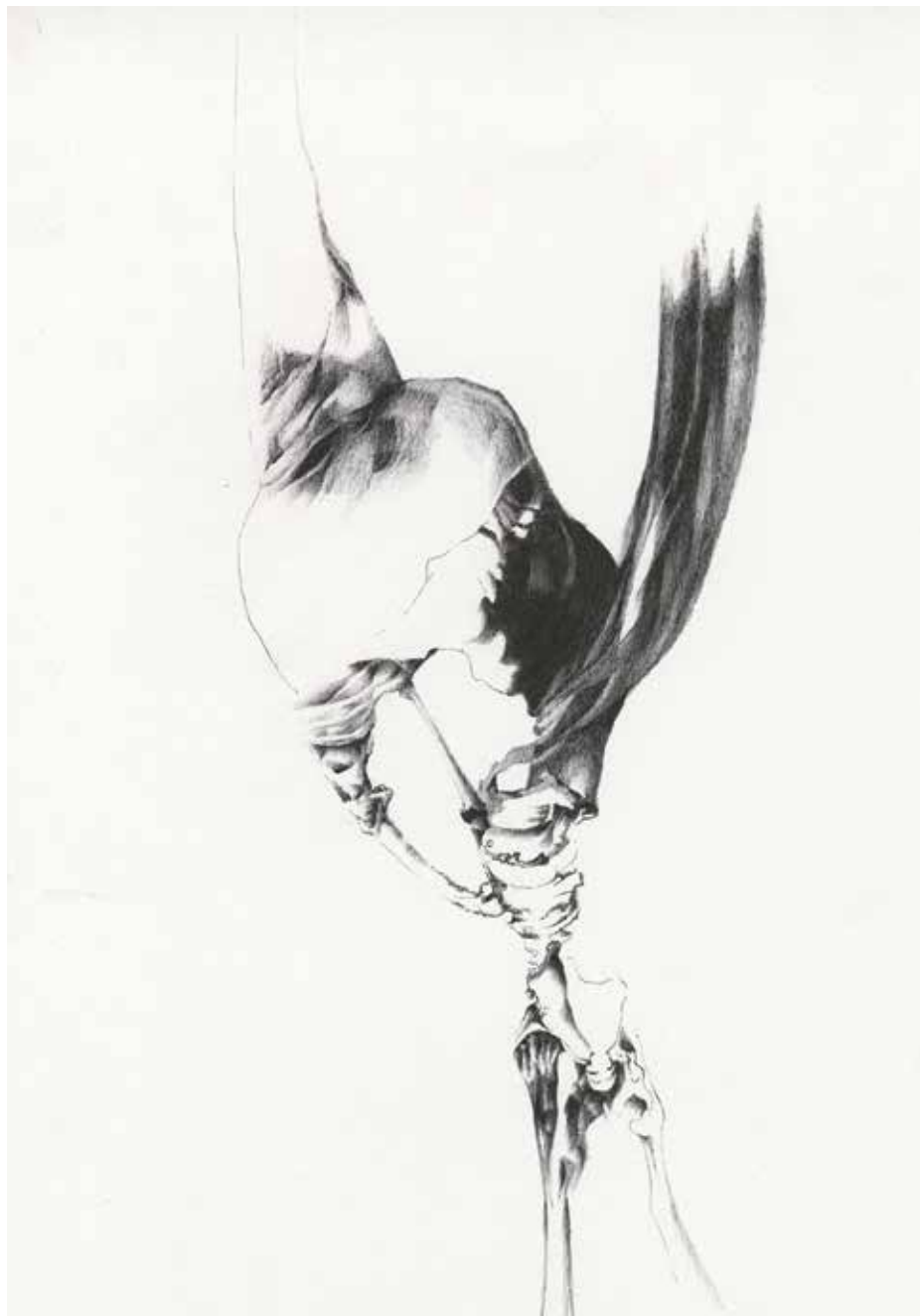
Tina Mohorović, Kosterne XVII, 2020, kemični svinčnik, 42 x 30 cm.