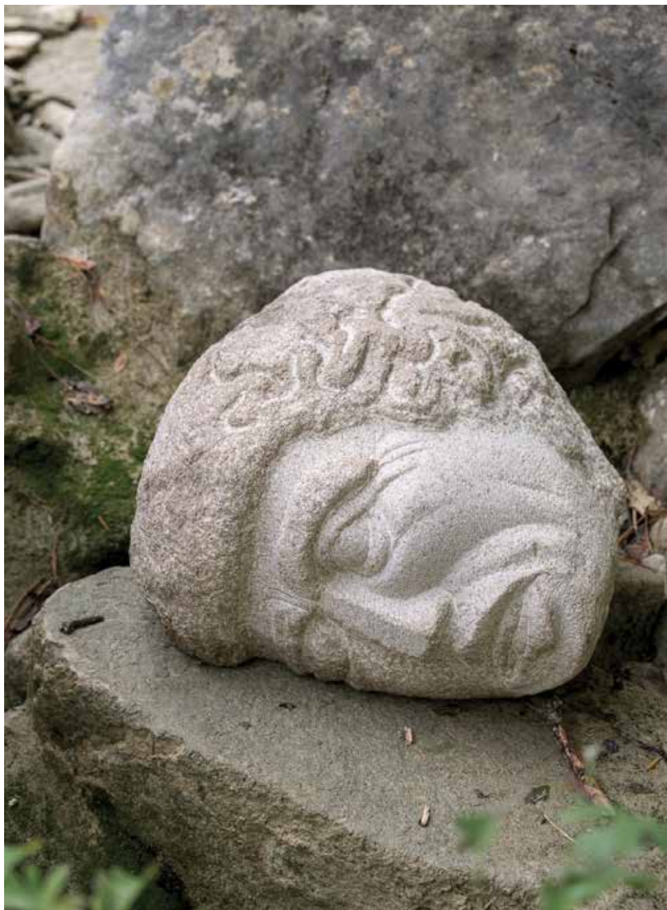
Damir De Simone, Nezavedanje, 2012–13, kamen (špica in kladivo), 38 x 33 x 23 cm.