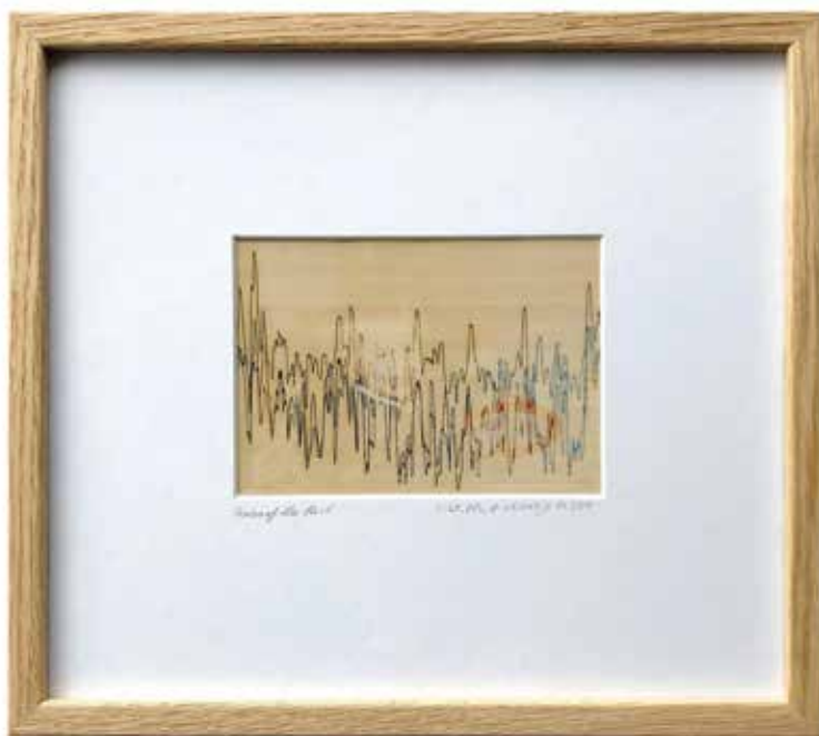
Dalea Kovačec, iz serije Traces of the Past / Sledi preteklosti: δ- 89.483, θ- 71.246, α- 87.781, 2020, lasersko graviranje na fotografijo, foto papir, 13,2 x 9,4 cm.