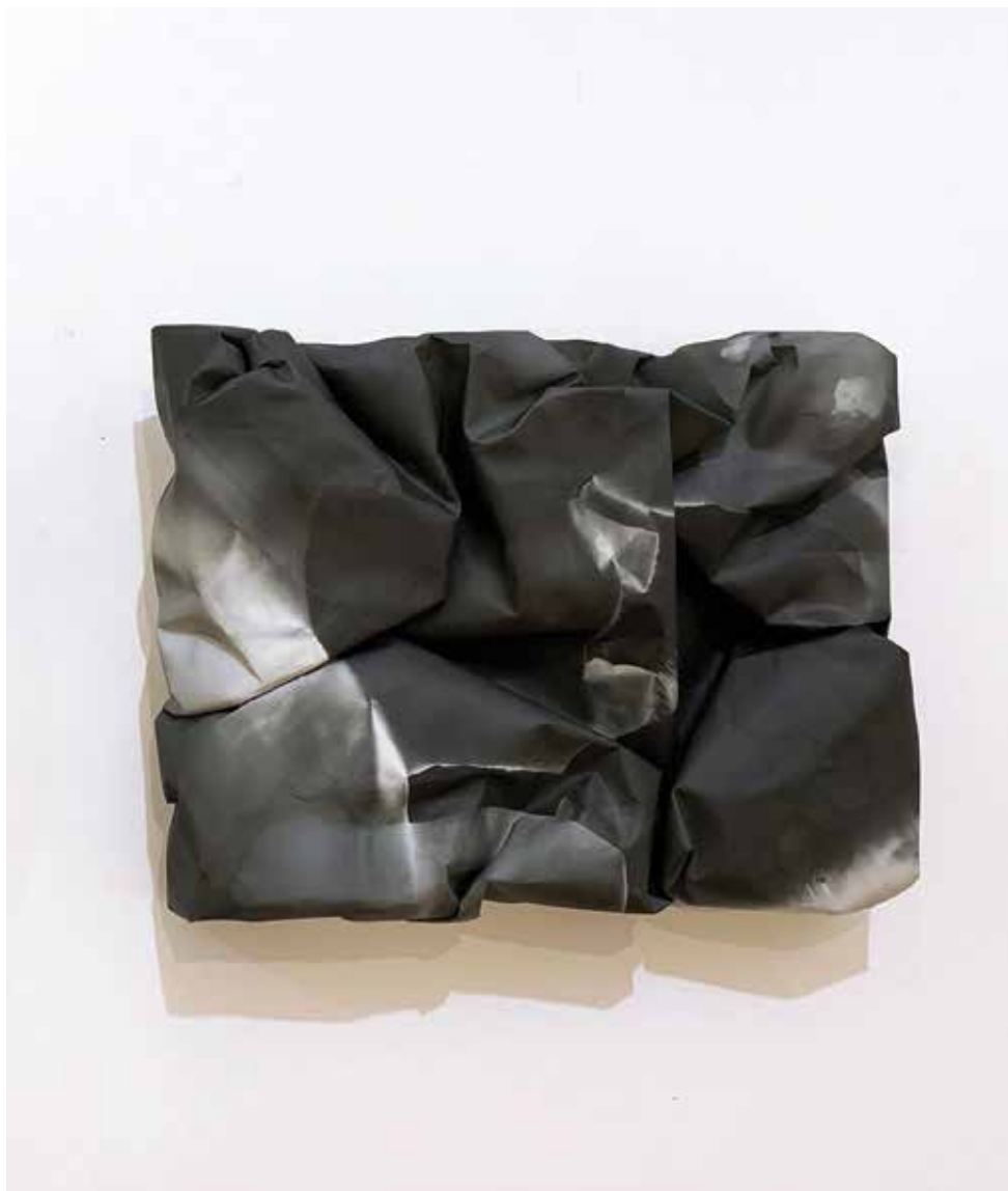
Anja Seničar, Liminal (triptih), 2019, srebro in želatinasti print na baritnem papirju, I: 40 x 30 x 8 cm; II: 30 x 26 x 8 cm; III: 30 x 40 x 8 cm, na sliki detalj Liminal III: 30 x 40 x 8 cm