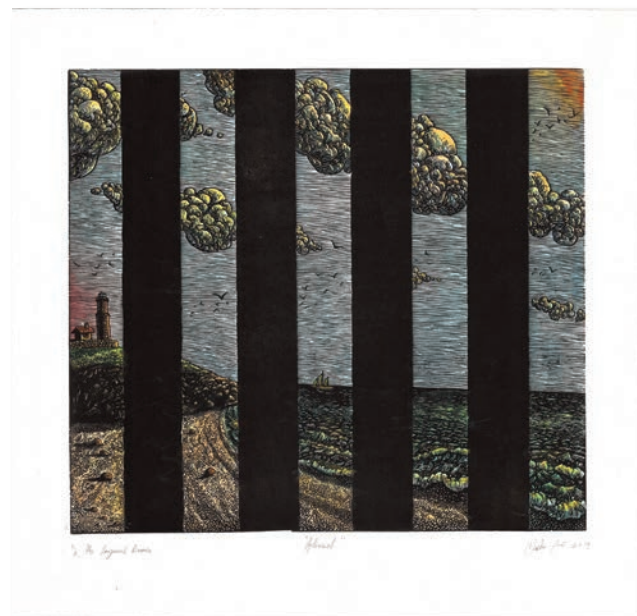
Miha Erič, Optimist , ročno barvan linorez, 40,7 x 36,3 cm, 2019

Miha Erič (1991, Ljubljana) je diplomirani oblikovalec vizualnih komunikacij – ilustrator, ki je samozaposlen v kulturi kot grafik in instrumentalist. Leta 2009 je končal strokovno smer Tehnik oblikovanja na Srednji šoli za oblikovanje in fotografijo Ljubljana. Diplomiral je leta 2013 na Akademiji za likovno umetnost in oblikovanje v Ljubljani. Pridobil je naziv diplomirani oblikovalec vizualnih komunikacij, smer Ilustracija. Skupaj z intermedijsko umetnico mag. Natalijo Šepul Erič je leta 2015 ustanovil Zavod za izobraževanje, umetnost, glasbo in kulturne dejavnosti Orbita, znan po številnih likovnih in glasbenih projektih, tako v Sloveniji kot tudi v tujini. Aktiven je na področju likovne in glasbene umetnosti. Pri likovni umetnosti ustvarja na področju umetniške grafike (lesorez, linorez, visoki bakrorez) in prav tako vodi delavnice grafike visokega tiska. Izbor samostojnih razstav: 2019 razstavišče JSKD Dravograd; Galerija Runa, Piran; galerija Miha Maleš, Kamnik; 2018 Grajska Galerija, Ravne na Koroškem; razstavišče Zveza Slovencev na Madžarskem, Monošter; 2017 Galerija MCC, Celje, Mediafest.