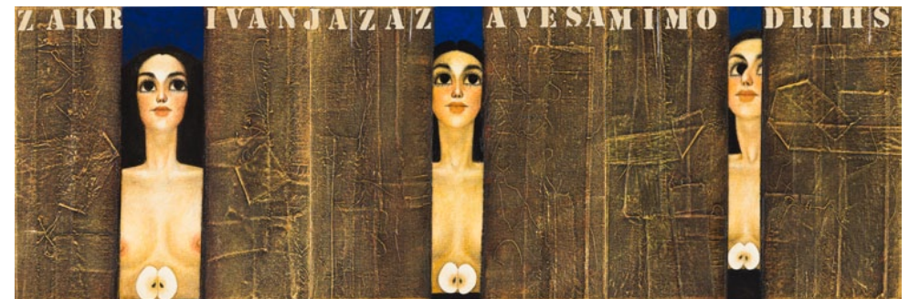
Zakrivanja ... , 2013, akril, kolaž platno, 40 × 120 cm

Rudi Skočir akademski slikar / Akademischer Maler