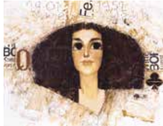
Kraljice ... , 2010, akril, kolaž platno, 40 × 47 cm