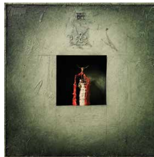
Prisotnost , 2004, mešana tehnika, 30 × 30 × 6 cm