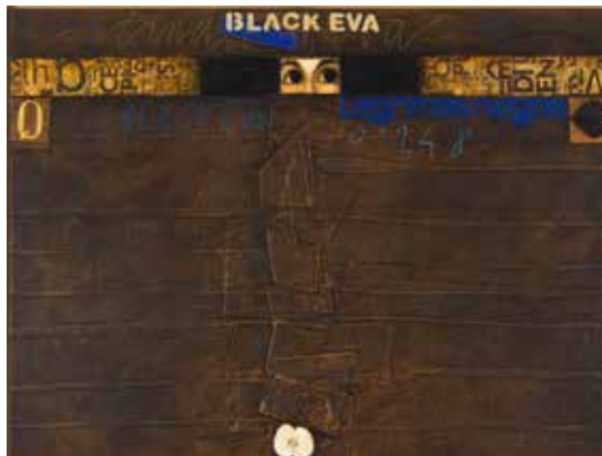
Črna Eva , 2012, akril, kolaž platno, 60 × 80 cm