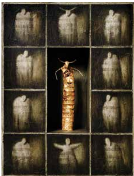
Poliptih , 2005, mešana tehnika, 32 × 24 × 6 cm

Katalog izdala Zveza društev slovenskih likovnih umetnikov zanjo Aleš Sedmak in Generalni konzulat Republike Slovenije v Celovcu Kustos razstave Olga Butinar Čeh Ljubljana, Celovec, 2013