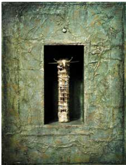
Čas druidov , 2005, mešana tehnika, 32 × 24 × 6 cm