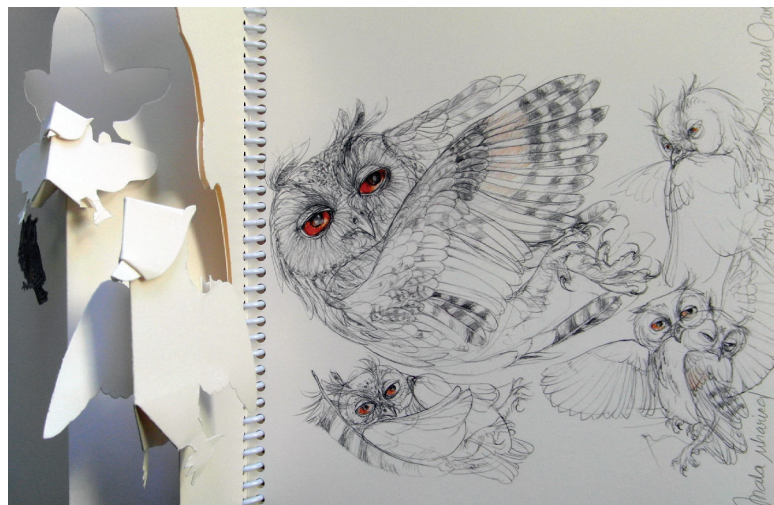
Mala uharica (Asio otus) / Waldohreule, 2015, kirigami, svinčnik in barvni svinčnik / Kirigami und Bleistift und Farbbleistift, 20 x 20 cm