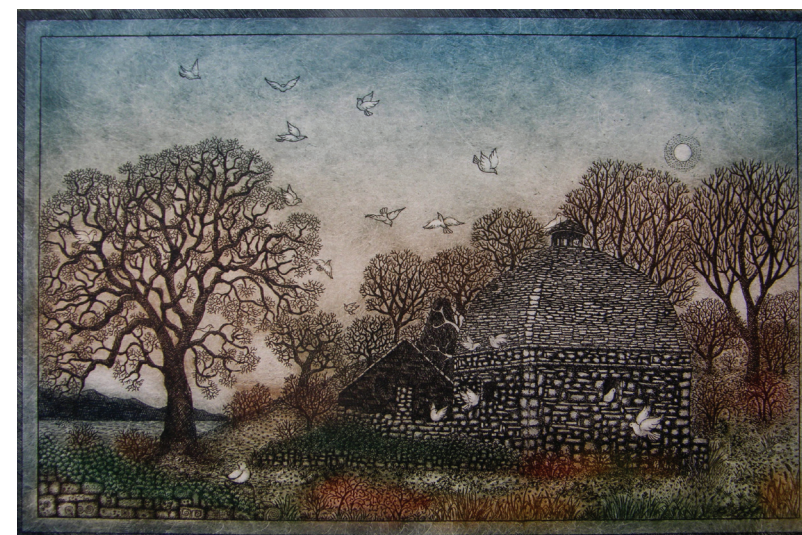
Stari golobnjak / Der alte Taubenhau, 2015, barvna jedkanica / Farbradierung, 20 x 30 cm