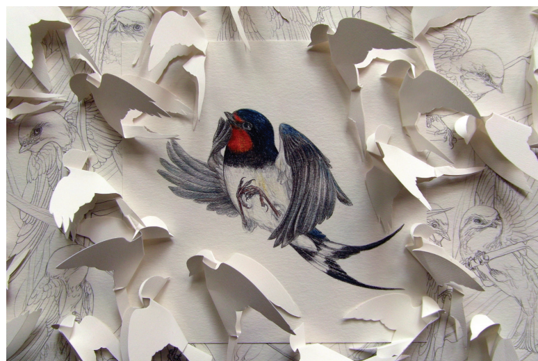
Kmečka lastovka (Hirundo rustica) / Rauchschwalbe, 2015, kirigami, svinčnik in barvni svinčnik / Kirigami und Bleistift und Farbbleistift, 17 x 17 cm