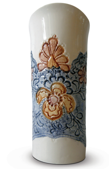
Vaza / Die Vase, 2016, keramika / Keramik, 20 x 8 cm