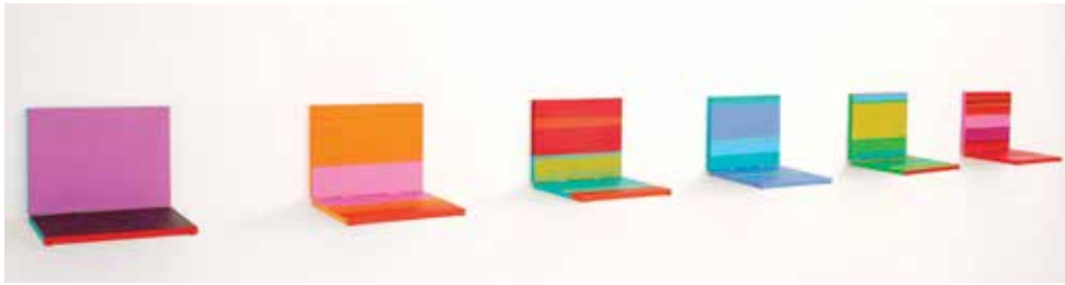
Mojca Zlokarnik: Objekte des anstreben / Objekti strmenja 1–6, 2013, Acryl auf Leinwand / akril naplatnu, 6 x (30 x 40 x 32 cm)