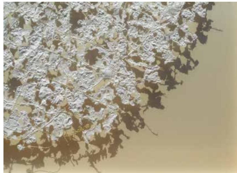
Detajl, HOLOGRAM / Hologramm, Cikel / Zyklus - Solve et Coagula, 2016, recikliran papir, bombažna in zlata nit / Recyclingpapier, Baumwolle - und Goldfäden, 87 x 87 cm