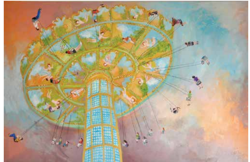
Veliki vrtljak / Das grosse Karussell, 100 x 150, olje na platnu / Öl auf Leinwand, 2017

Berufsvereinigung Bildender Künstler Österreichs Landesverband Kärnten