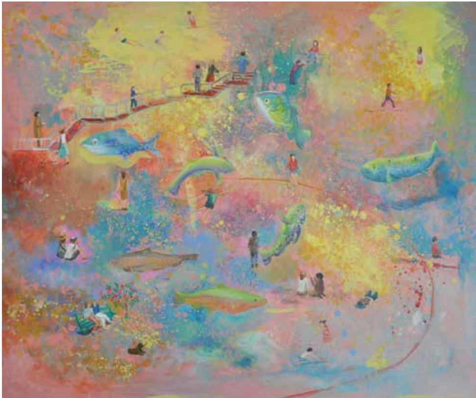
Akvarij / Aquarium, 100 x 120, olje na platnu / Öl auf Leinwand, 2017.