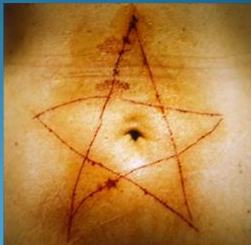
Marina Abramovič: BALKAN BAROK, 1997