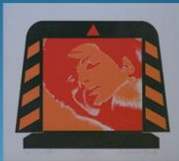
Warhol: MM, 1962 in Logar: Figura, 1976