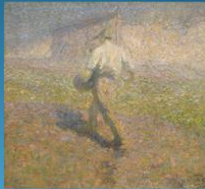
Kopalke, 1898-1905 / stabilnost in ravnotežje Sejalec, 1907