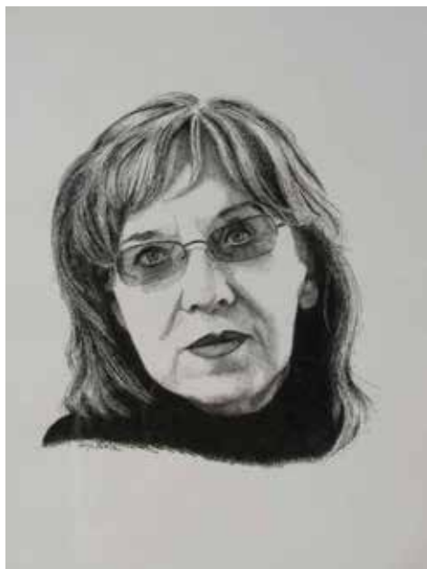
Svetlana Makarovič, borka na področju literature