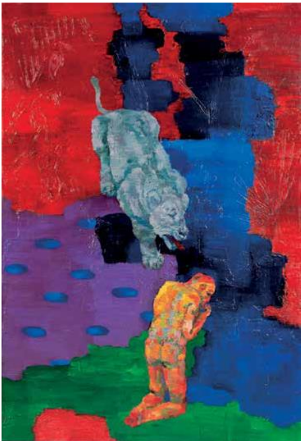
Izvir, 2012, olje na platnu, 130 × 88 cm

Akademski slikar, magister umetnosti, ki bo imel prihodnje leto samostojno razstavo v okviru Majskega salona 2015.