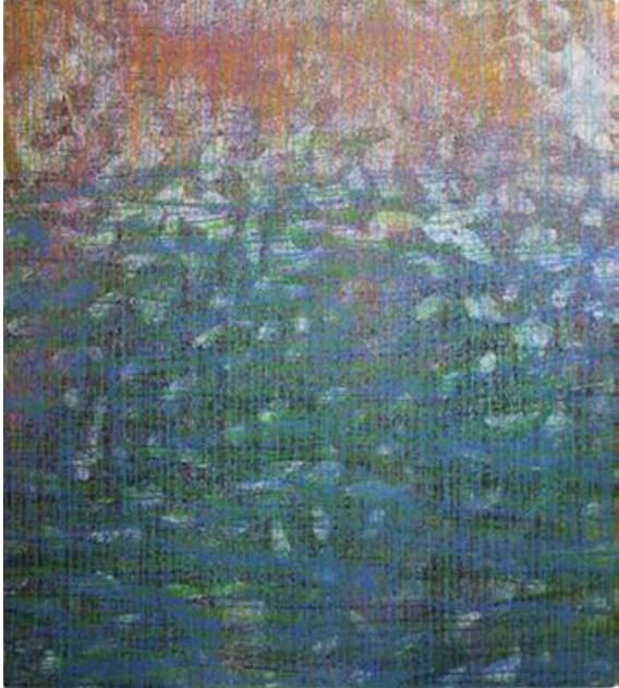
Voda, voda, voda, 2011, akril na platnu, 136 × 121 cm