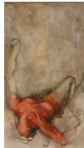
FRANC VOZELJ Homo padanje olje na platnu, 120 × 70 cm, 2015