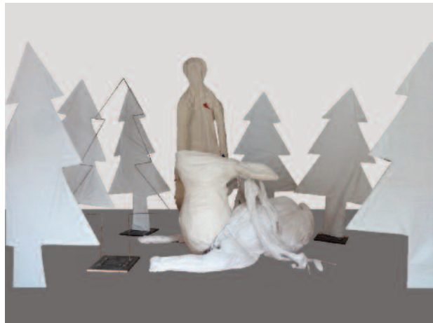
ZORAN SRDIĆ JANEŽIČ Životonjsko & človeško carstvo blago / plastika, 2016