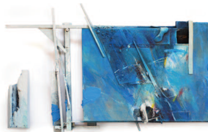
MARKO TUŠEK Izhod 14 mešana tehnika, 41 × 67 × 6 cm