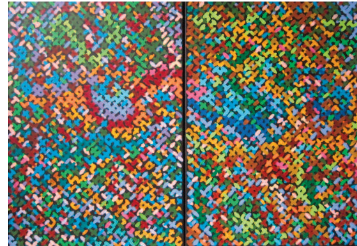
IZTOK ŠMAJS MUNI Dyptich, from Dxom/I series akril na platno, 2 × 50 × 70 cm, 2015/16