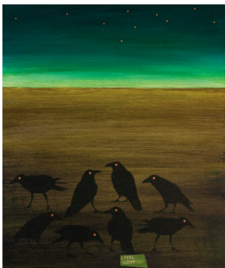
CVETO ZLATE Na sončni strani Alp akril na platnu, 60 × 50 cm, 2015