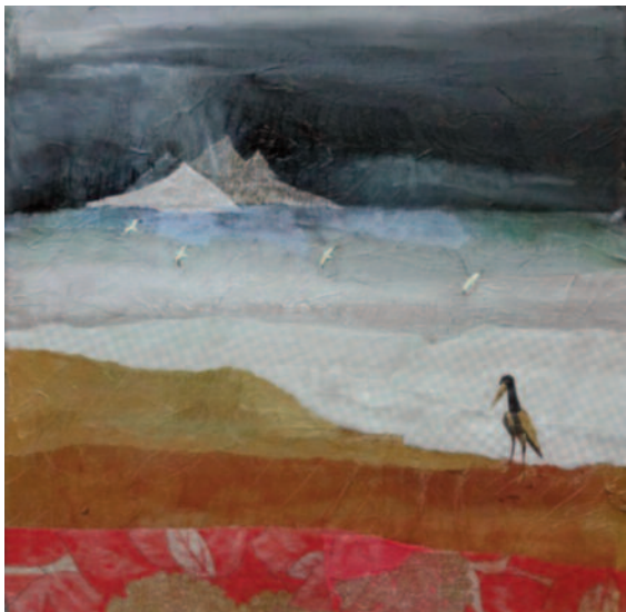
MARUŠA ŠTIBELJ Nevihita (diptih) kolaž in akril na platnu, 50 × 50 cm, 2016