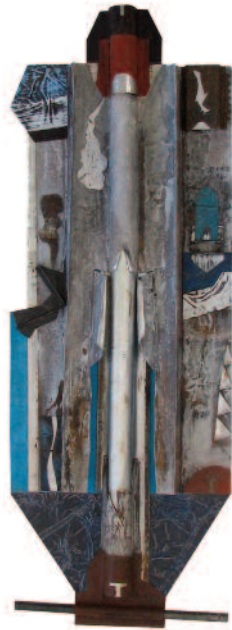
KAROL KUCHAR Maska mešana tehnika, 2016