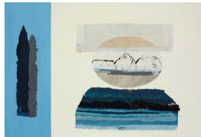
KLEMENTINA GOLIJA Iz cikla Potovanje skozi čas mešana tehnika, 70 × 100 cm, 2015/16