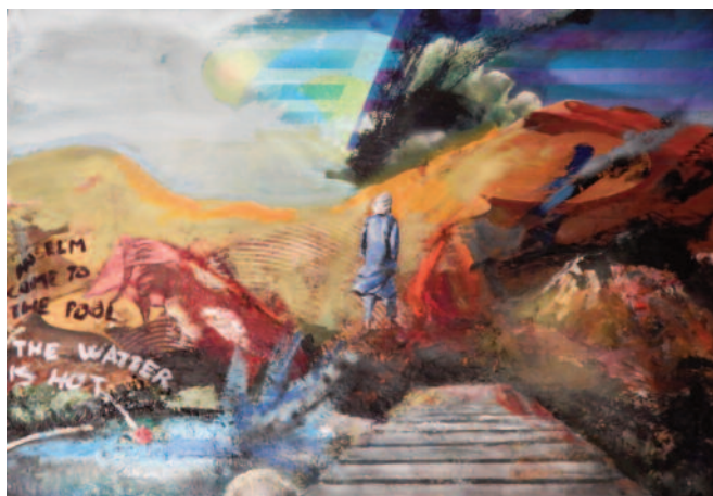
ANDREJA ERŽEN Anselm come to the pool_ The water is hot akril, saharški pesek, platno, led luč, 70 × 100 cm, 2016