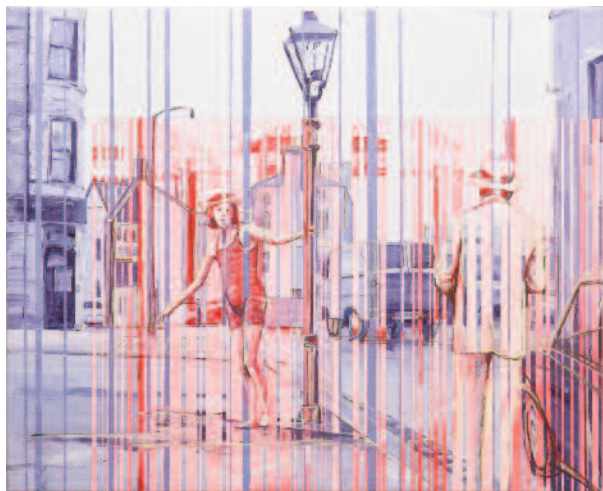
KAJA URH Pass by and go around II svinčnik in akril na platnu, 40 × 50 cm, 2015