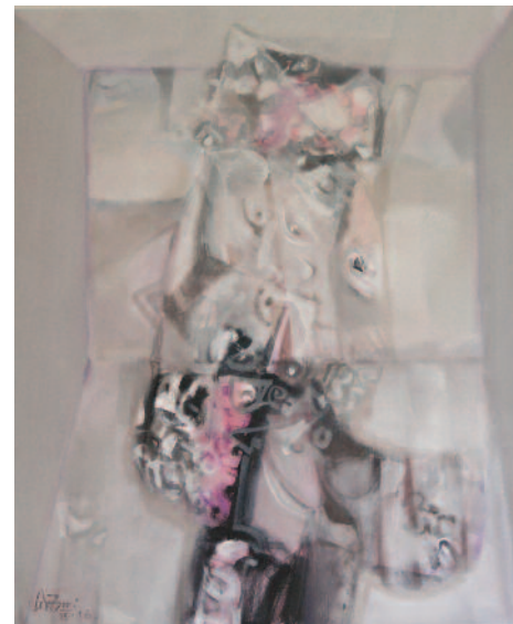
BONI ČEH Brez naslova akril na platnu, 2015